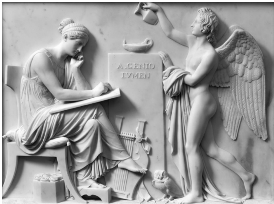
20. Bertel Thorvaldsen, A Genio Lumen , 1808-1828, Copenhagen, Thorvaldsens Museum