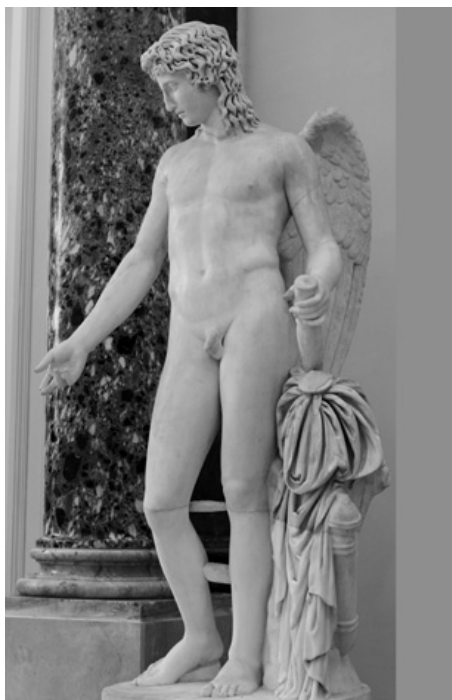
7. Eros Farnese , Napoli, Museo Archeologico Nazionale

pura e incorrotta classicità eroica. In seguito l'artista costituiva rapidamente un suo personale Olimpo di divinità, programmaticamente alternativo a quello ideato da Canova, dove reinterpretava con spirito di sistema tutto il retaggio formale e morale classico, a cominciare dalle statue di Ganimede , Psiche , Amore e Psiche , Ebe e Apollo 10 .