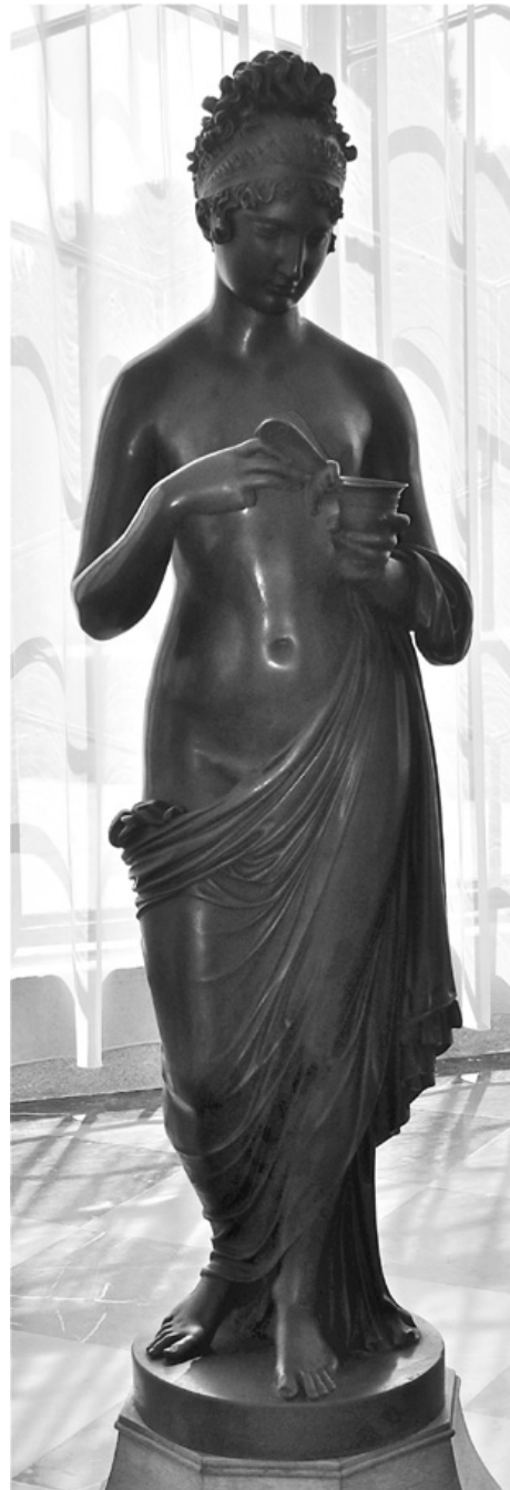
26. Leopold Kiesling, Psiche , 1825 circa, bronzo, Castello Liechtenstein (Eisgrub), Lednice

Kiesling muore il 27 marzo 1827 nella sua casa a Vienna. Fino ad oggi la sua fama si basa soprattutto sulle opere eseguite durante il soggiorno romano, dove si poté muovere nell'ambito dei protagonisti della scultura classica riportandone le idee dal Tevere fino al Danubio attraverso la sua opera più famosa fino ad oggi, Marte, Venere ed Amore . Finora il luogo di conservazione delle altre opere che realizzò a Roma è sconosciuto ed è per questo che la riscoperta del Genio che svela la Natura è di grande significato per la comprensione delle opere giovanili di Kiesling. È quindi da auspicare che grazie ad un crescente interesse per lo scultore ed al riconoscimento dell'importante ruolo che svolse nella comunità artistica romana e dell'alta qualità delle sue opere, sia possibile identificare in futuro altre opere dell'artista.