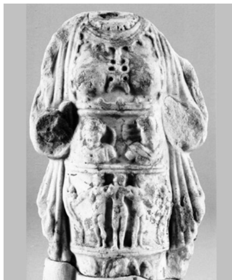
10. Torsetto di Afrodite di Afrodizia , Napoli, Museo Archeologico Nazionale