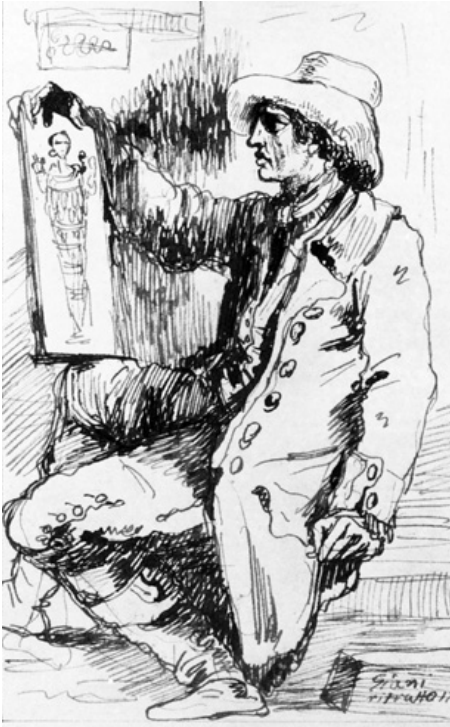
16. Felice Giani, Autoritratto con lo schizzo di Artemide Efesia , 1789, Torino, Galleria d'Arte Moderna e Contemporanea

privilegiato del gruppo composto dal Genio e dal simulacro della Diana Efesina è quello frontale, privo delle dinamiche impresse da Canova alle sue opere. Tuttavia la statua era stata concepita come autonoma e isolata, similmente al Marte , Venere e Cupido di cui Guattani precisava: “il gruppo è [...] fatto perché resti isolato; onde veggasi da tutti i lati e presenti d’ogni intorno, con variato sempre contrasto di linee, nuovo e piccante effetto.” 19 I modelli del danese tuttavia non erano copiati, ma piuttosto emulati come quelli antichi secondo la prassi dell’imitazione ideale, che consisteva nel tentativo