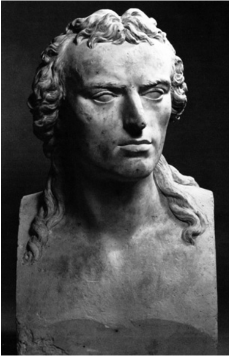
22. Johann Heinrich Dannecker, Erma di Friedrich Schiller , Marbach, Schiller-Nationalmuseum/Deutsches Literatur-archiv

ne ingentilita di sentimento e ragione, attraverso il motivo prediletto della grazia, la bellezza in movimento. In questa chiave anche l'attitudine del Genio, che sottrae il proprio sguardo dalla natura, intuendola ma non osservandola direttamente, appare richiamare il motivo del poema di Schiller Das verschleierte Bild zu Sais (1795), che preclude alla sete di conoscenza dell'uomo di svelare, proprio nella personificazione egizia di Iside, la verità e il mistero della natura 35 . E Schiller sembra rievocato persino dalle fattezze ideali, ma come si è detto dotate di un tratto individuale e non canonico, del vol-