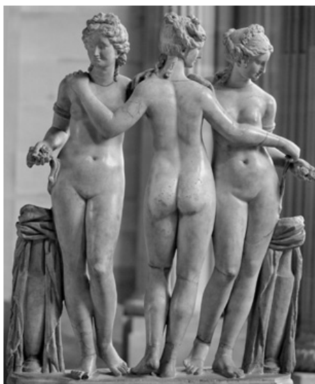
11. Le tre Grazie , Parigi, Musée du Louvre

interpretato dinamicamente e con un significato più scoperto – il volto di Marte presenta le fattezze di Napoleone – nel coevo gruppo di Luigi Acquisti, terminato nel 1806 e destinato al mecenate lombardo Giambattista Sommariva. Il successivo progetto di Thorvaldsen per un gruppo di Marte e Venere era risolto inizialmente, nel 1810, come statua isolata del dio della guerra e infine come gruppo anacreontico, grazie all'aggiunta della figura di Cupido nell'attitudine di sottrarre la spada a Marte mentre questi è impegnato a valutare la potenza delle armi di Amore. In seguito si aggiungevano alla serie anche i gruppi di Canova per Giorgio IV d'Inghilterra e quello dell'inglese romanizzato John Gibson per il duca di Devonshire, celebrativi ormai dell'avvenuta Restaurazione 14 .