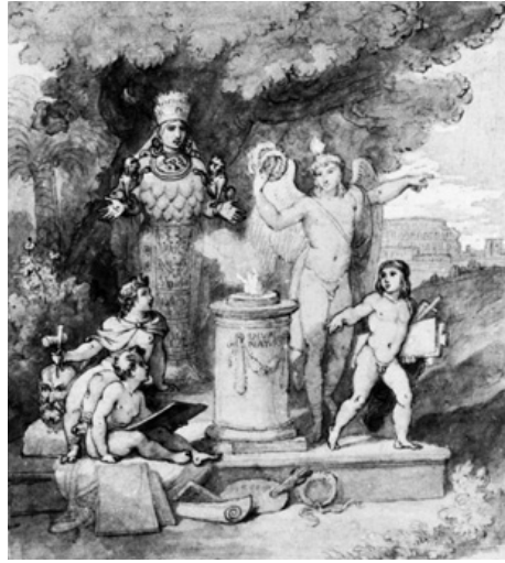
17. Tommaso Minardi, Il Genio delle Belle Arti offre le tre corone all'altare di Artemide Efesia come dea della Natura , 1808, Roma, Galleria Nazionale d'Arte Moderna

Proprio la presenza di questa personificazione allegorica doveva rendere la statua ancora più eloquente nell'ambito del dibattito artistico contemporaneo, una figura virtuosisticamente cesellata nei suoi attributi, derivati da una crasi tra quelli di due diverse divinità orientali, Artemide Efesia dalle numerose "mammelle" e i simboli zodiacali e Afro-