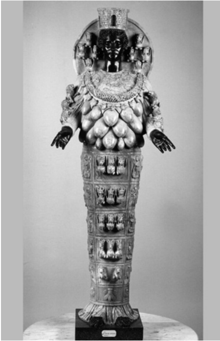
8. Artemide Efesia , Napoli, Museo Archeologico Nazionale