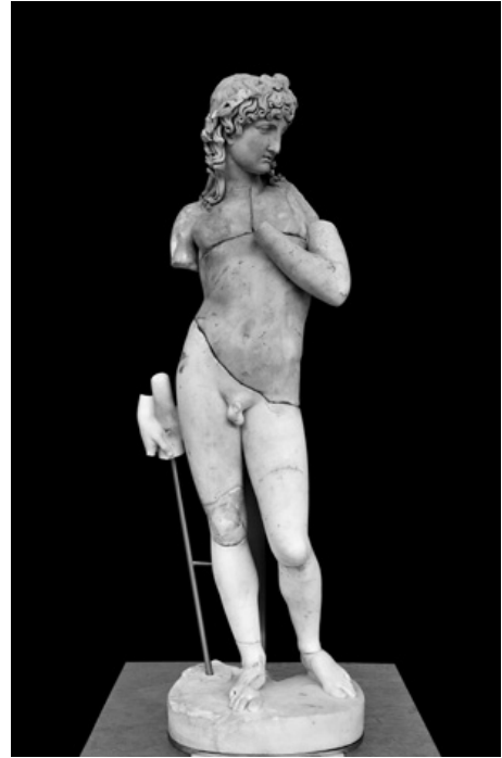
2. Konrad Heinrich Schweickle, Cupido trionfante , 1802 (modello), Ludwigsburg, Schloss Ludwigsburg

fezionò in una figura singola, quasi di altezza naturale, l'immagine di un genio delle arti, che svela la natura. Il bel giovane, che tiene nella mano la corona della fama, alza con l'altra un velo sulla statua della dea della natura. La statua della natura è parzialmente dorata. Tra gli emblemi, a forma di una piramide girata, che ornano il piede rastremato della dea, l'artista si è preso la libertà di fare alcune variazioni, in quanto ha aggiunto tra l'altro il Dio e la Dea delle belle arti e scienze, e le tre Grazie. la statua ha un effetto felicissimo ed è rifinita in modo splendido” 2 .