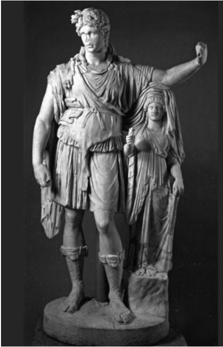
5. Dioniso Hope , New York, The Metropolitan Museum of Art

era stata da questi venduta, secondo l'autore dell'articolo, a causa di una nudità integrale che doveva spiacergli. L'acquirente, il noto antiquario Kubasch, l'aveva quindi ceduta al banchiere Gustav Fisch. Questi l'aveva collocata in una nicchia nello scalone del suo palazzo 8 , costruito nel 1878-80 da Victor Rumpelmeyer. E infine il Genio era stato acquistato da Max Schmidt, direttore della celebre fabbrica di arredi, legata ad Adolf Loos, F.O. Schmidt 9 . L'appartenenza alla collezione Liechtenstein doveva risalire alle generazioni precedenti quella citata. È probabile che la statua vi facesse il suo ingresso intorno al 1825,