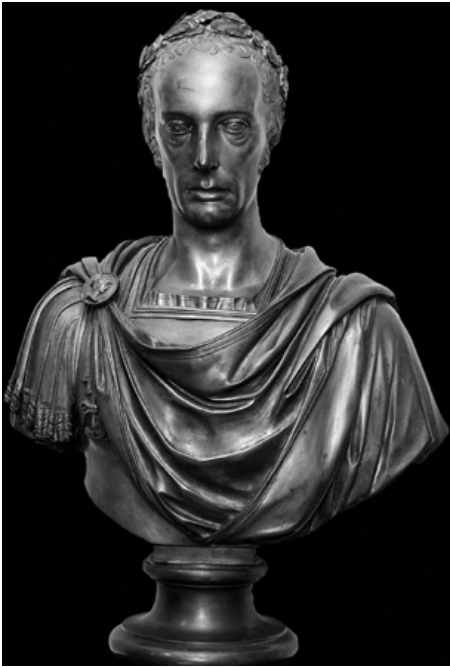
25. Leopold Kiesling, Francesco II , bronzo, Landesmuseum für Kärnten, Klagenfurt

egualmente a Roma come pensionato austriaco nel 1808 e che esegue il rilievo di Venere che mostra a Marte la sua mano ferita da Diomede per il piedistallo della statua, riprende il tema della composizione nel disegno Unità e Pace (1816) 34 . Il gruppo di Kiesling rappresenta allora, non solo un esempio emblematico dello scambio e del dialogo artistico avvenuto con grande intensità all'interno della comunità artistica a Roma all'inizio dell'Ottocento, ma anche una prova del ruolo che l'artista viennese svolse nelle dispute in corso.