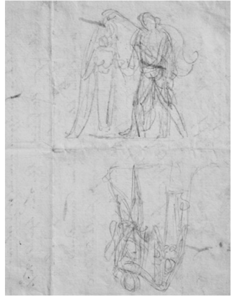
13. Bertel Thorvaldsen, Apollo citaredo svela la Natura come Diana Efesina , 1805, Copenhagen, Thorvaldsens Museum

di supervisione sull'esecuzione del gruppo per l'imperatore, affidatogli proprio durante il viaggio del 1805 a Vienna.