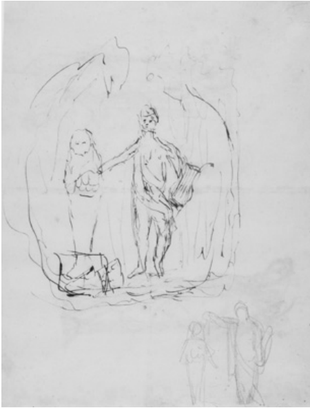
12. Alexander von Humboldt (attribuito a), Bertel Thorvaldsen, Apollo citaredo svela la Natura come Diana Efesina , 1805, Copenhagen, Thorvaldsens Museum