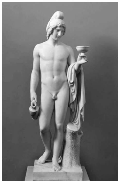
3. Bertel Thorvaldsen, Ganimede stante , 1804 (modello)-1826, Copenaghen, Thorvaldsens Museum