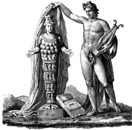
14. Bertel Thorvaldsen, disegnatore, Raphael Urbain Massard, incisore, Apollo svela la Natura come Diana Efesina , vignetta sul frontespizio del volume di Alexander von Humboldt, Ideen zu einer Geographie der Pflanzen , Tübingen-Paris 1807

Tutti questi artisti erano animati dall'aspirazione di creare opere classiche ma originali. Così si muoveva anche Kiesling, che nel Genio doveva aver guardato a Thorvaldsen per definire il flessuoso andamento di un'anatomia semplificata, trattata per ampie superfici, priva delle