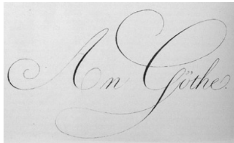
15. An Goethe , la dedica sul frontespizio delle Ideen zu einer Geographie der Pflanzen di Alexander von Humboldt

asprezze della statuaria eroica e rifinita con grande cura, ma senza voler mutare la nobile natura lapidea del marmo per suggerire effetti di morbidezza vivente, come nelle epidermidi canoviane. Alla pari delle citate composizioni del danese, di cui Kiesling impiegava anche la scala, leggermente inferiore al vero, il lato