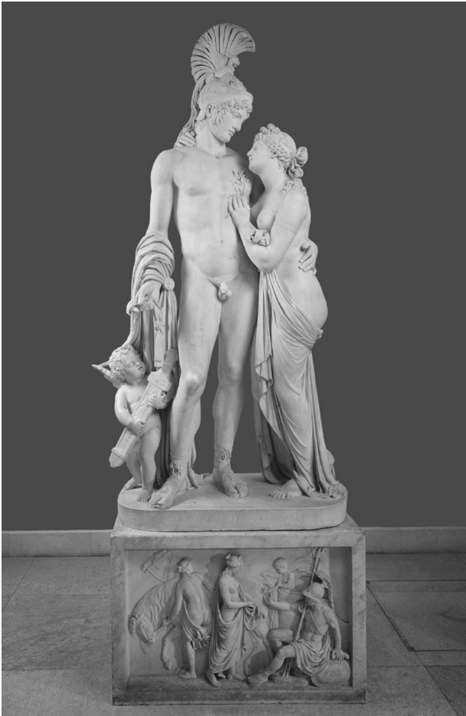
24. Leopold Kiesling, Marte, Venere ed Amore , marmo, Oberes Belvedere, Vienna