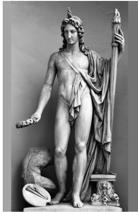
21. Gaetano Matteo Monti (di Ravenna), Il Genio delle Arti , 1835, Pavia, Pinacoteca Malaspina

Il Genio rivelava poi, classicamente e nel suo significato più piano, il fondamento delle arti nella mimesi della natura. La bellezza ideale che egli stesso incarna scopre nella Natura scelta e ricomposta armonicamente