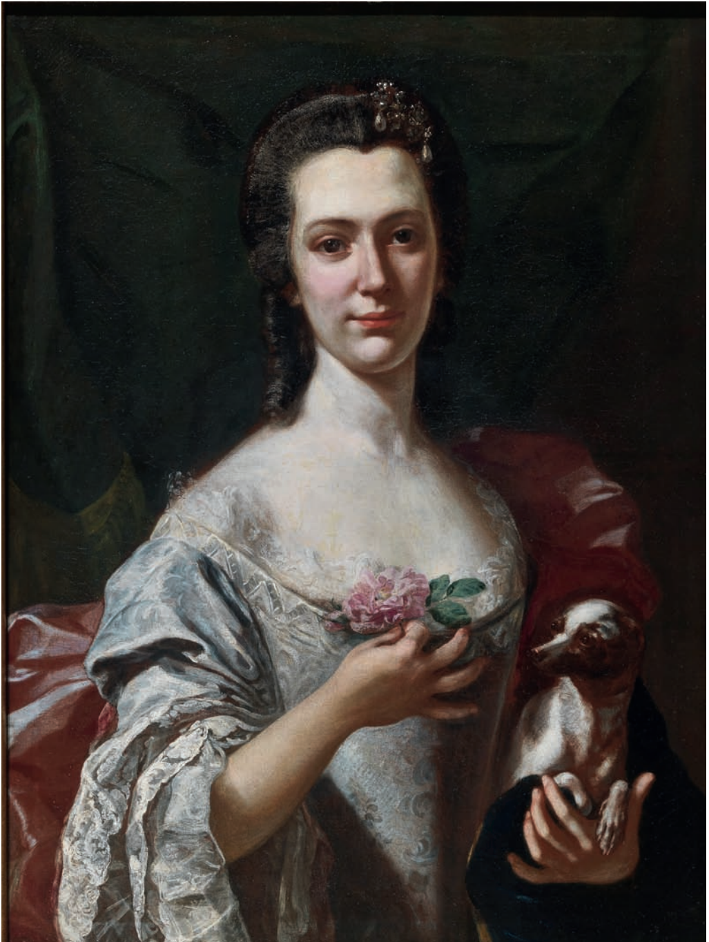
III. Carlo Amalfi, Ritratto di una dama della famiglia Serra di Cassano .