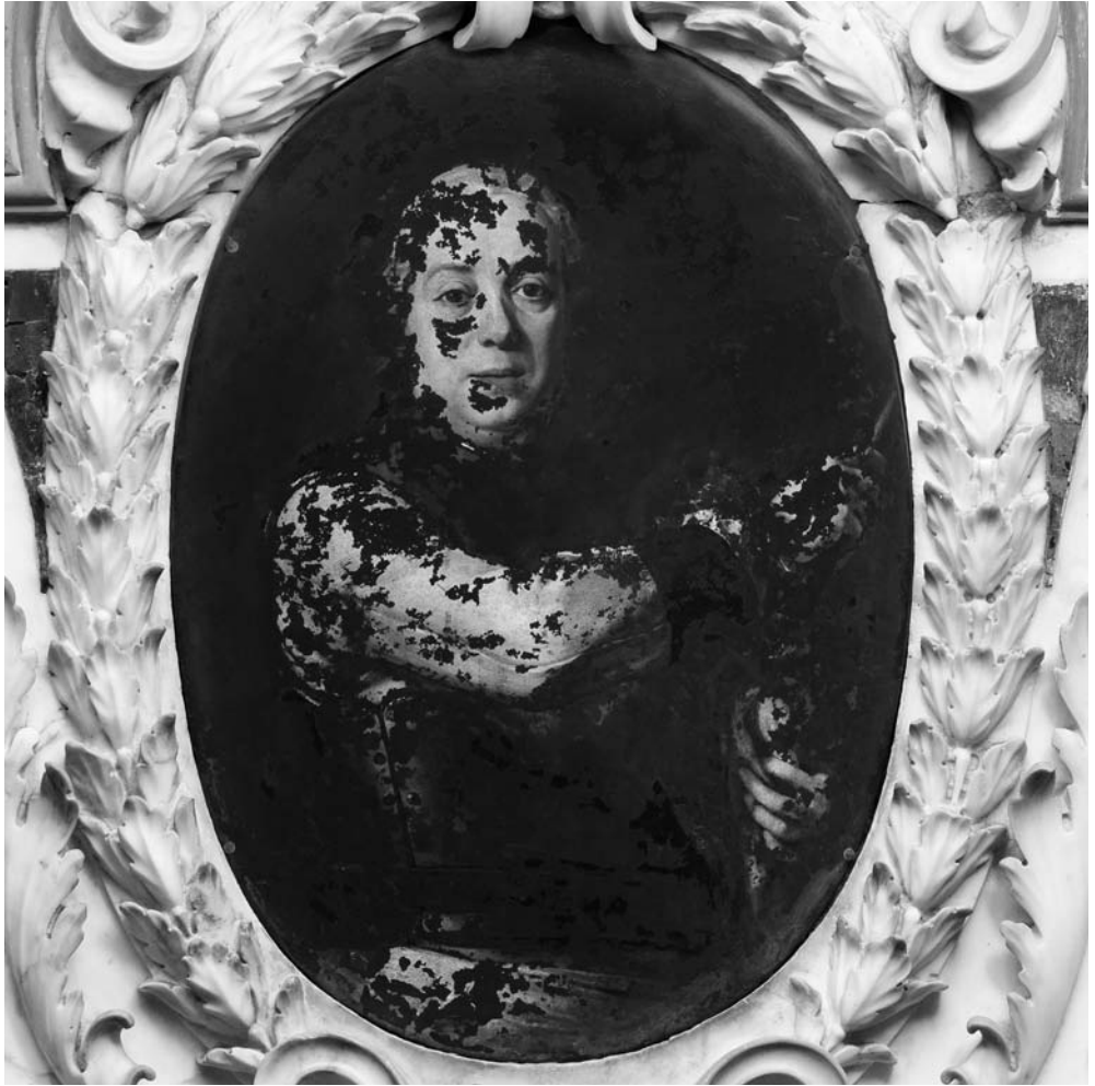
2. Carlo Amalfi, Ritratto di Raimondo Di Sangro VII principe di Sansevero . Napoli, Museo Cappella Sansevero.