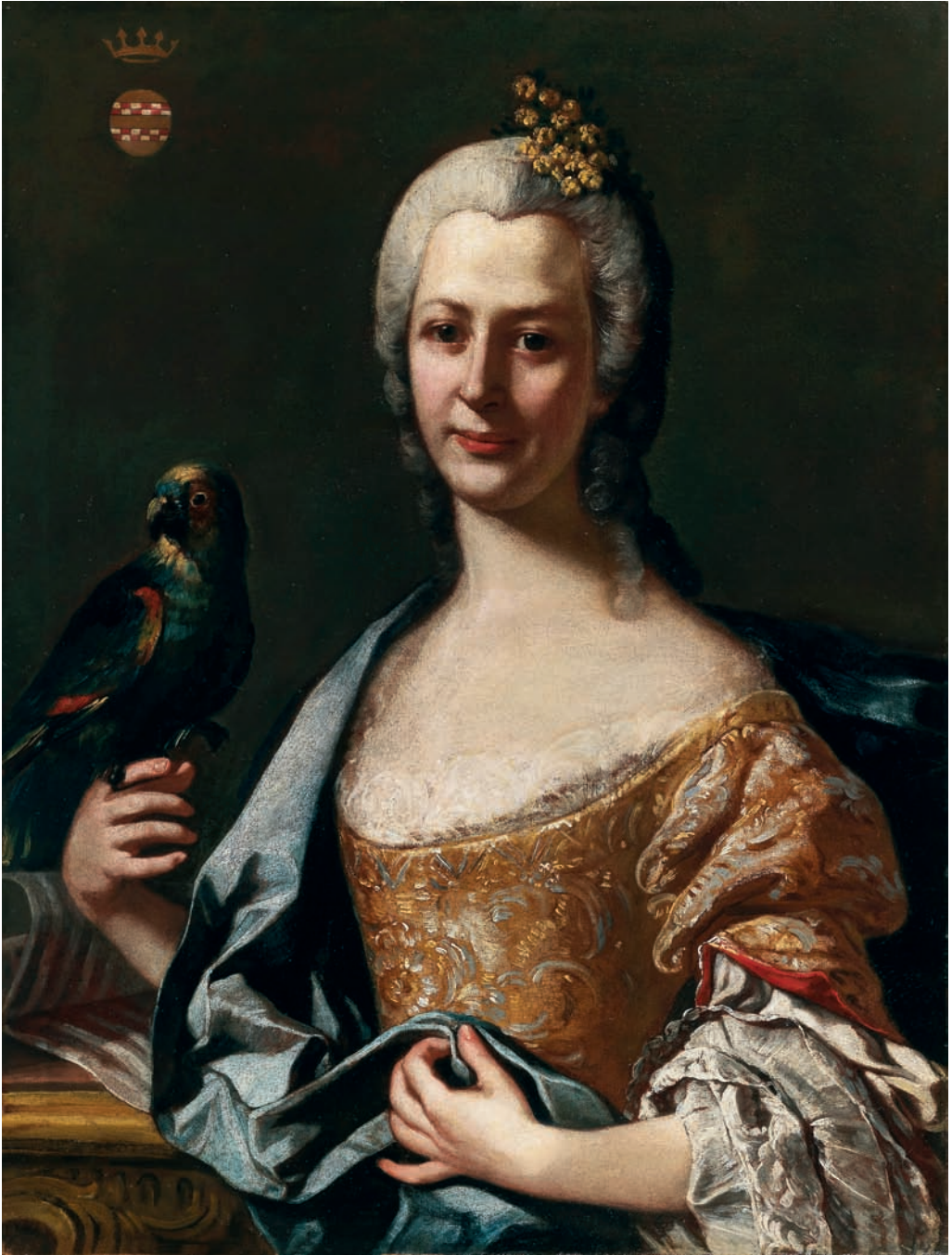
V. Carlo Amalfi, Ritratto di una dama della famiglia Serra di Cassano .