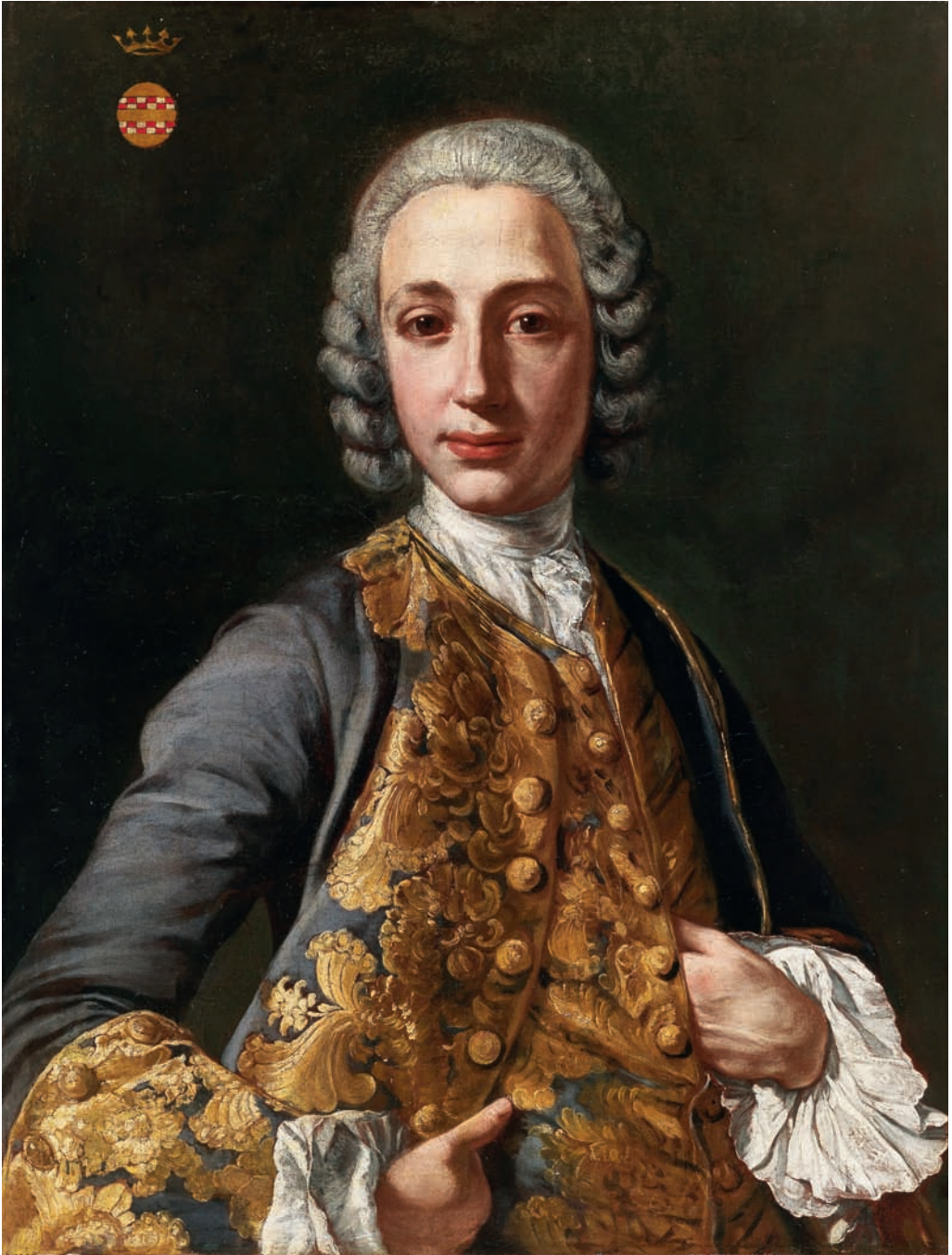
IV. Carlo Amalfi, Ritratto di un gentiluomo della famiglia Serra di Cassano.