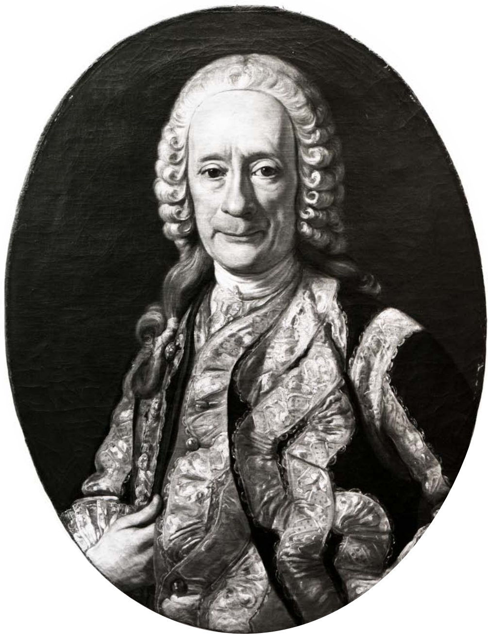
1. Carlo Amalfi, Presunto ritratto di Bernardo Tanucci . Ubicazione sconosciuta.