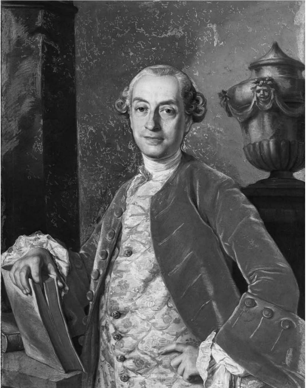
5. Carlo Amalfi, Ritratto di gentiluomo . Sorrento, Museo Correale di Terranova.