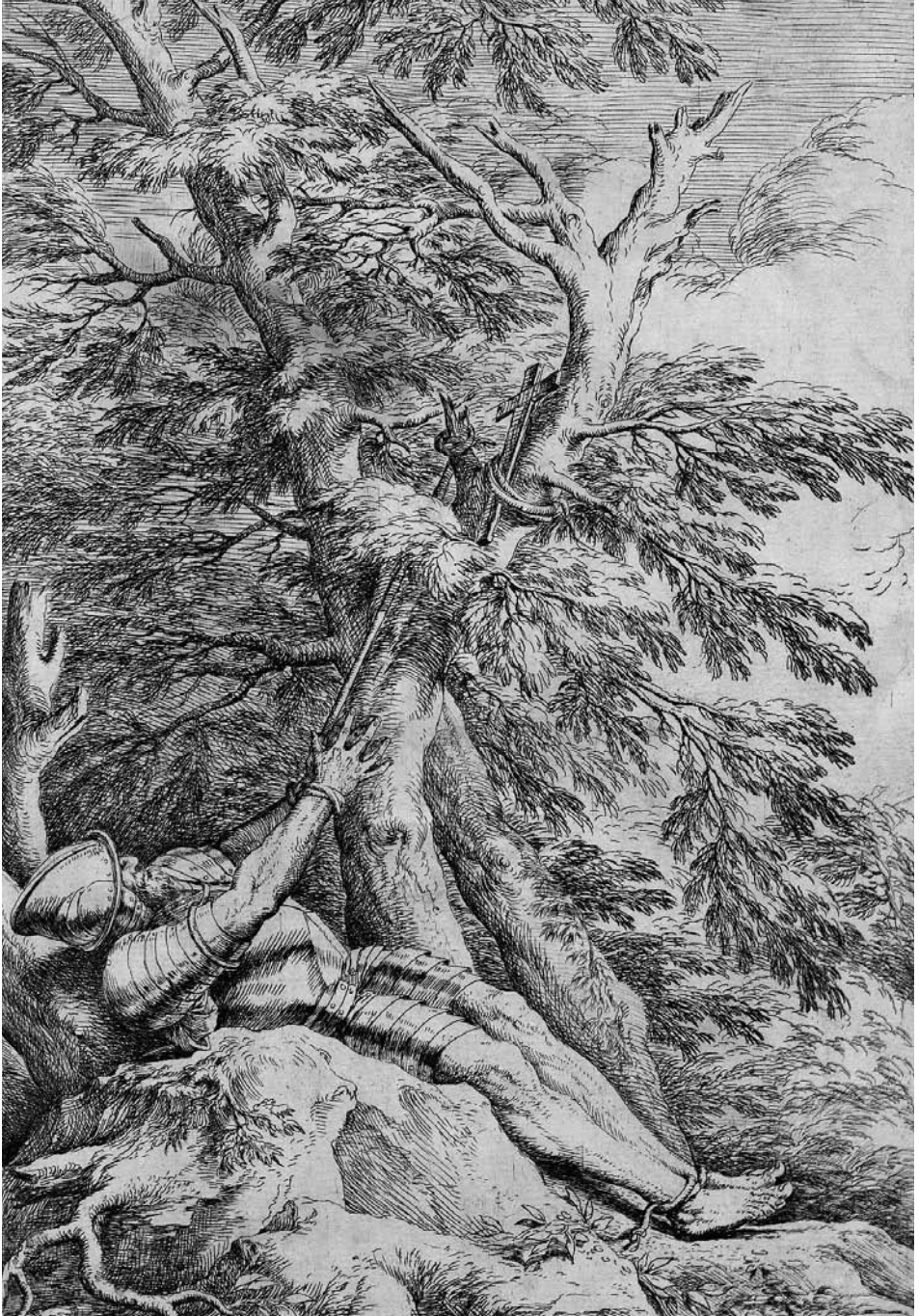
6. Salvator Rosa, St William of Maleval . London, British Museum, Department of Prints and Drawings