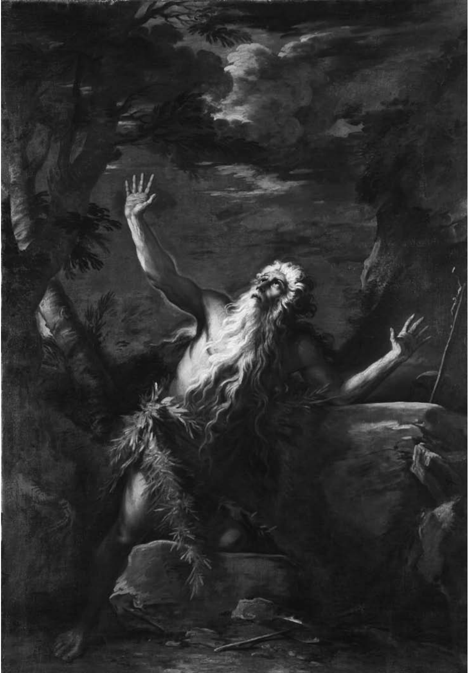
4. Salvator Rosa, St. Onuphrius . Matelica, Pinacoteca comunale "Raffaele Fidanza"