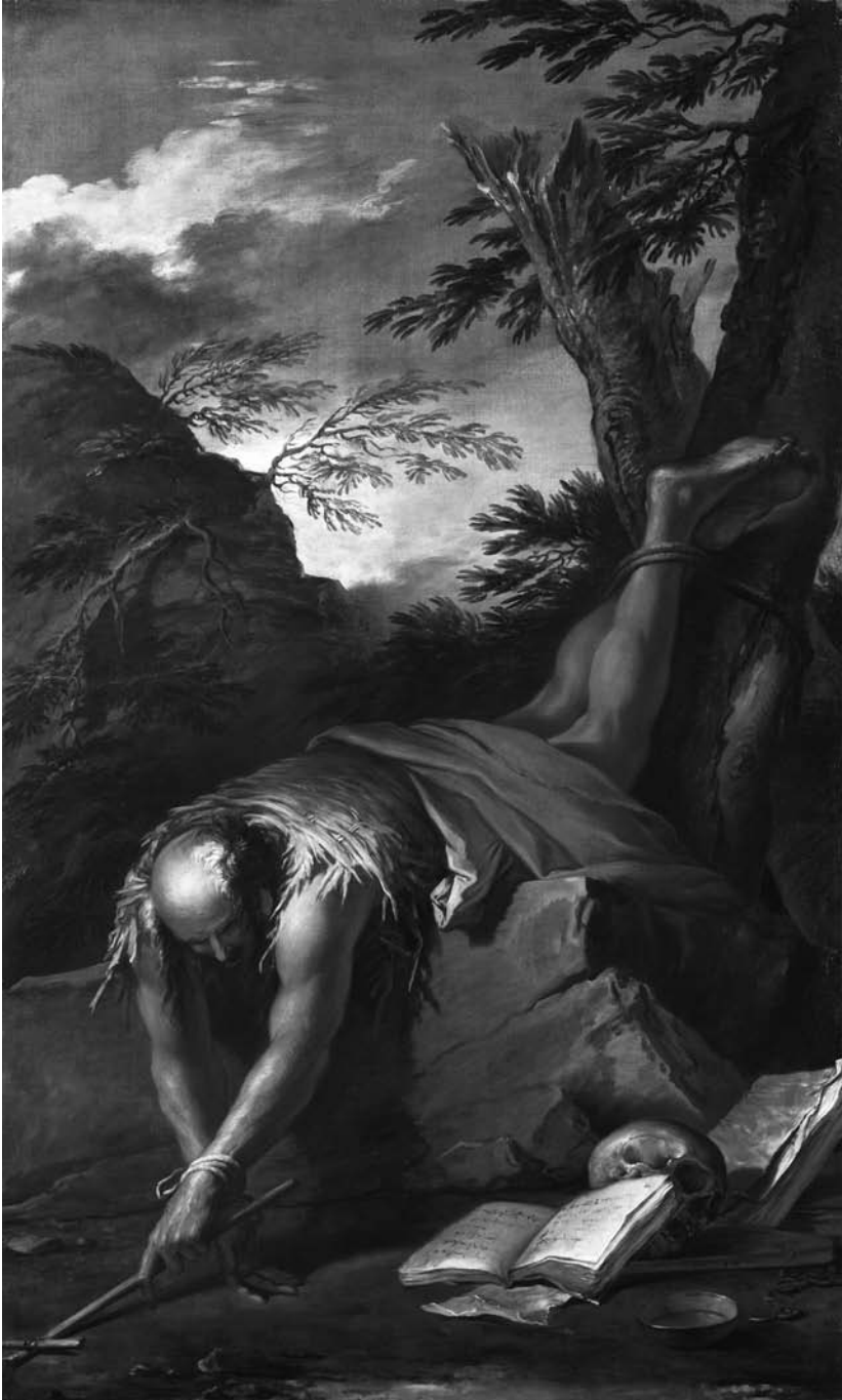
3. Salvator Rosa, St Paul the Hermit . London, Matthiesen Gallery