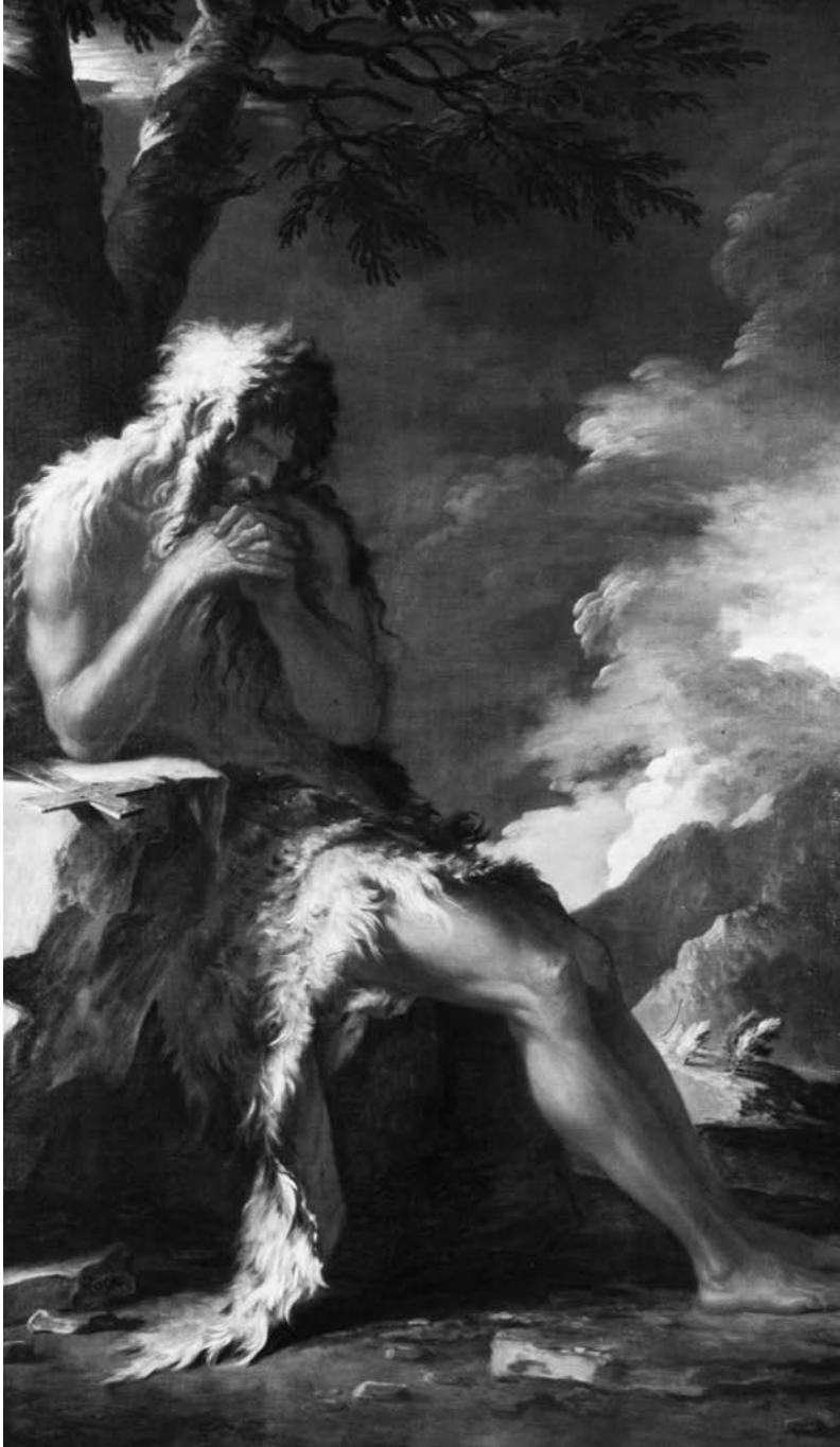
2. Salvator Rosa, St Onuphrius . Minneapolis (MN), The Minneapolis Institute of Arts