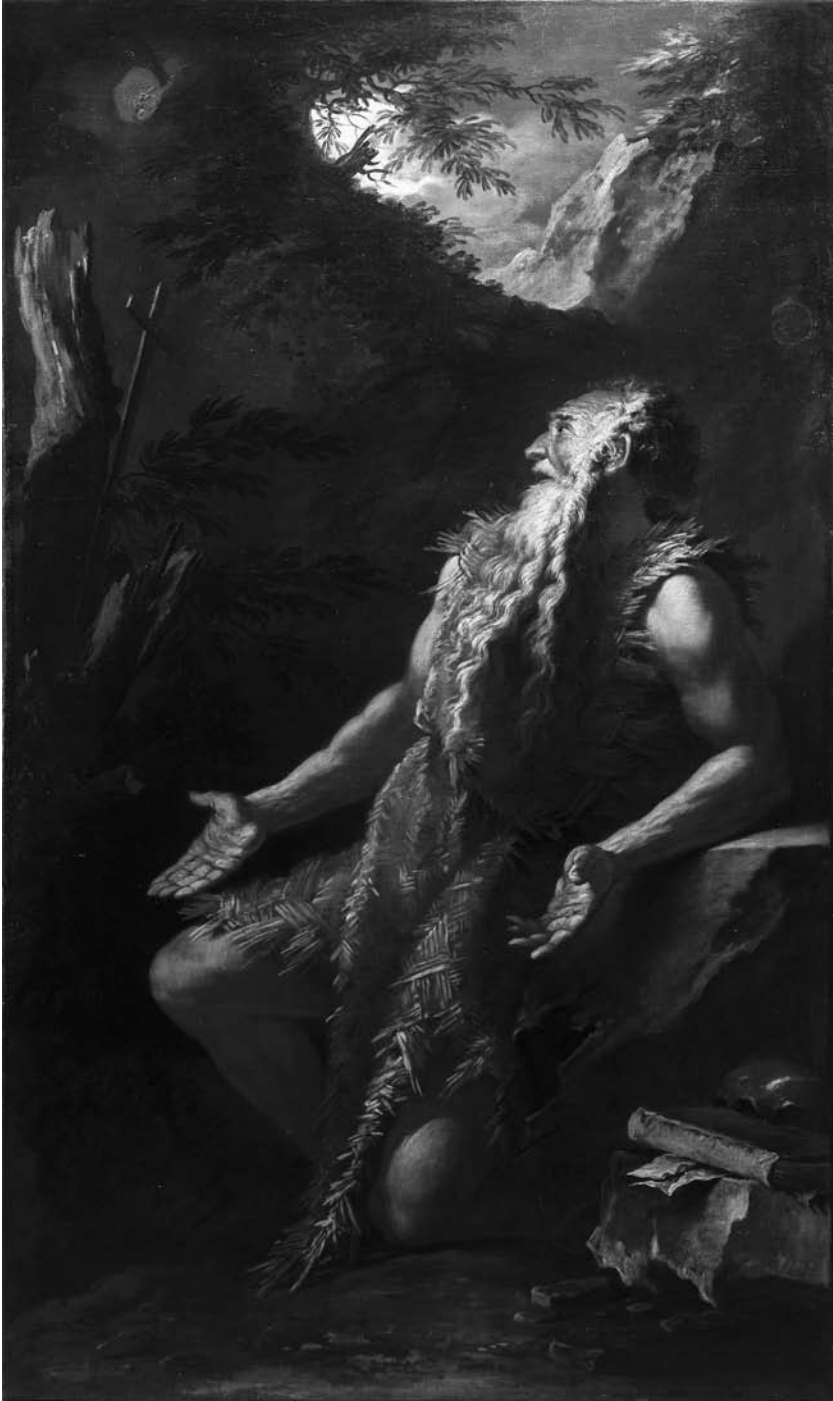
1. Salvator Rosa, St Paul the Hermit . Galleria Carlo Virgilio