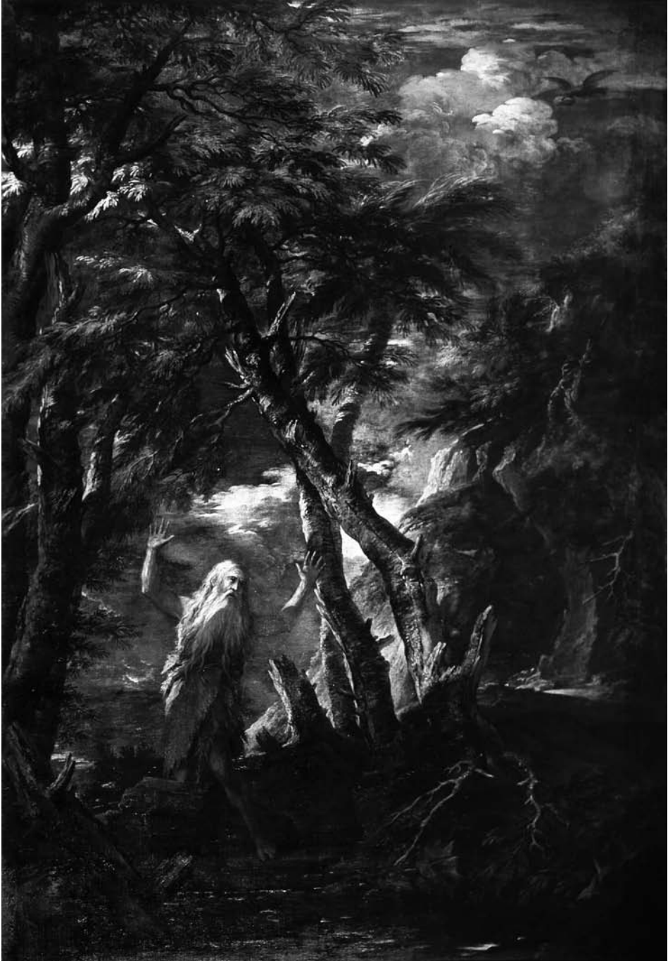
5. Salvator Rosa, St Paul the Hermit . Milan, Pinacoteca di Brera